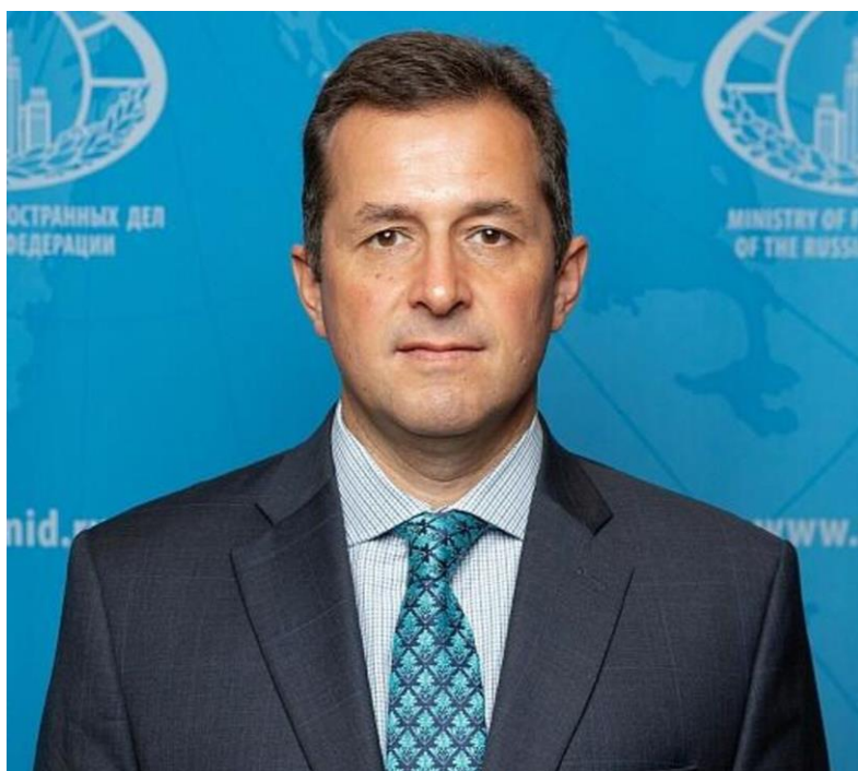
Интервью Директора Первого департамента стран СНГ МИД России Микаэла Агасандяна

стабильности. Мы не стремимся к подмене уже существующих дискуссионных форматов, однако нацелены на создание собственной уникальной коммуникационной площадки, пригодной для обсуждения основ будущего многополярного мироустройства. Необходимо подчеркнуть, что Вторая Минская конференция с точки зрения количества и статусности участников, содержательности мероприятий, в том числе по линии ОДКБ, сделала заметный шаг вперед, что позволяет заявить о наличии международного интереса и рассчитывать на большое будущее этой инициативы.