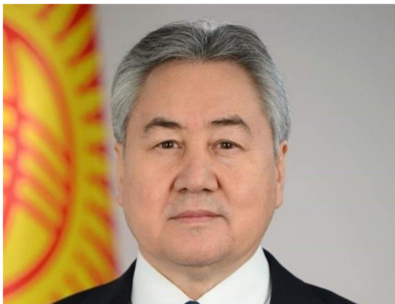
Интервью Министра иностраннх дел Кыргызстана Жээнбека Кулубаева

Происходит активное взаимодействие на уровне экспертов. С этой целью проводятся различные мероприятия, в ходе которых сотрудники обсуждают актуальные проблемы, осуществляется обмен опытом. Представители СНГ и ШОС присутствуют в качестве наблюдателей на наших учениях и операциях. В последний период интенсивно развивается взаимодействие по информационно-аналитической линии. В целом же ОДКБ, СНГ и ШОС обладают чрезвычайно большим военно-политическим и экономическим потенциалом и имеют все возможности для формирования новой, более справедливой и эффективной архитектуры безопасности в Евразии.